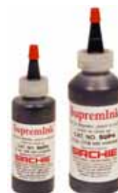
SUP2 et SUP4