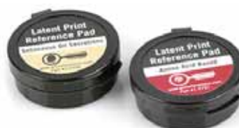
EZ2791 et EZ2792