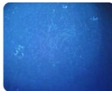
Cheveux avec UV