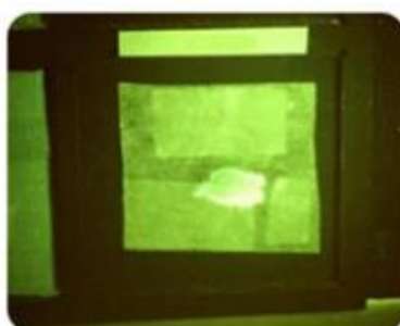
Salive sur compresse