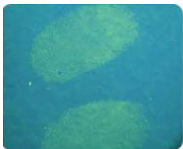
Transpiration et empreinte